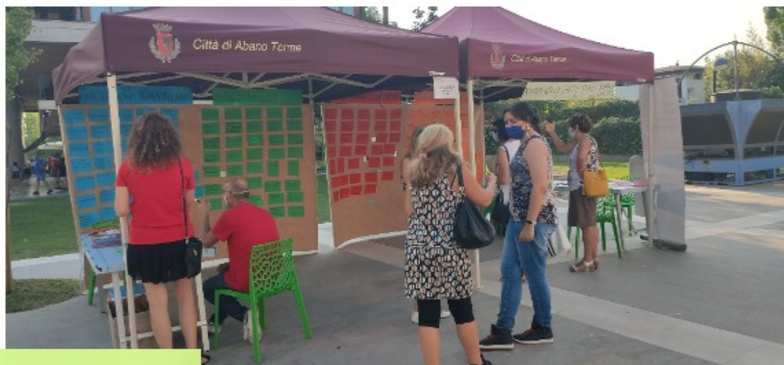
Abano Terme (PD) settembre 2020 Carta delle associazioni